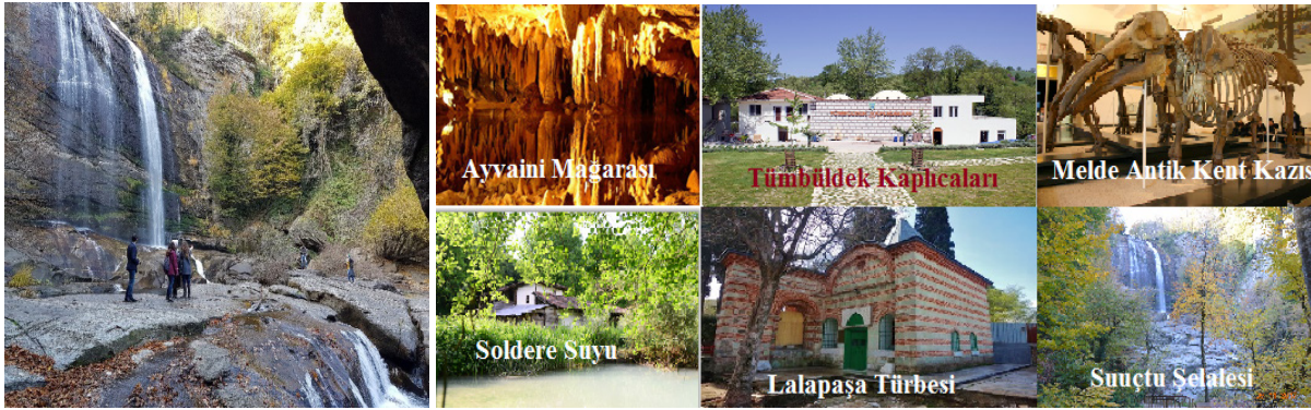
Şekil 4. Suuçtu Şelalesi

Mustafakemalpaşa Çayı ve Camandar Deresi ilçenin başlıca iki önemli akarsuyudur. Mustafakemalpaşa Çayı’na akan Soldere suları, ağaçlık bir vadide akarak Hacıali Köyü yakınlarında Mustafakemalpaşa Çayı’na ulaşır. Kabulbaba, İlyasçılar, Güller ve Hacıali’deki 12 adet su değirmenini üzerinde bulundurur (Anonim, 2014). İlçenin kimliği ile özdeşleşen Suuçtu Şelalesi ise Mustafakemalpaşa merkezine 18km uzaklıktadır. 38 metreden dökülen şelale birçok rekreatif etkinliğe olanak sağlamaktadır (Şekil4).